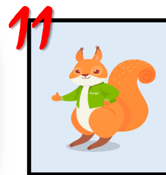
VOTO EN BLANCO